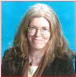
Eileen Scanlon Regno Unito/United Kingdom

Codirettore del Centre for Research in Education and Educational Technology, The Open University Tra le sue molte attività di ricerca, ama citare la partecipazione a Kaleidoscope : rete di eccellenza , un progetto che riunisce esperti europei per lo scambio di conoscenze con l'obiettivo di studiare e sviluppare nuovi concetti e metodi l'apprendimento con tecnologie digitali.