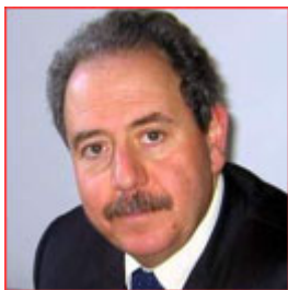
Carlo Mochi Sismondi Italia/Italy

Dirige il FORUM PA in qualità di direttore generale e partner. Insegna e scrive sui temi della riforma della pubblica amministrazione, della comunicazione pubblica, dell’e-government.