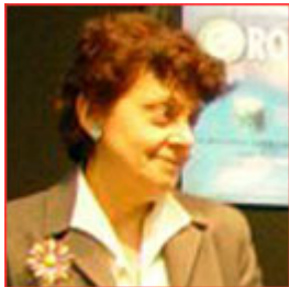
Fiorella Operto Italia/Italy

Member of the European Parliament; Deputy chairperson of the International Commerce Commission