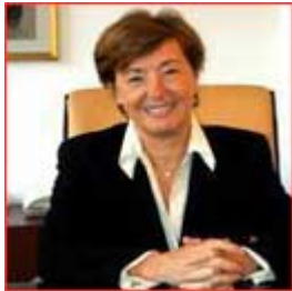
Pia Locatelli Italia/Italy

Parlamentare europea e membro della Commissione per i diritti delle donne e l'uguaglianza di genere e della Commissione industria, ricerca ed energia.